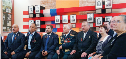
На Алтае стартовала «Вахта героев Отечества»