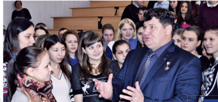
Эстафету героев приняла Пенза