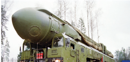
55 лет на страже мира